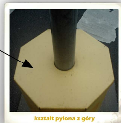
kształt pylona z góry