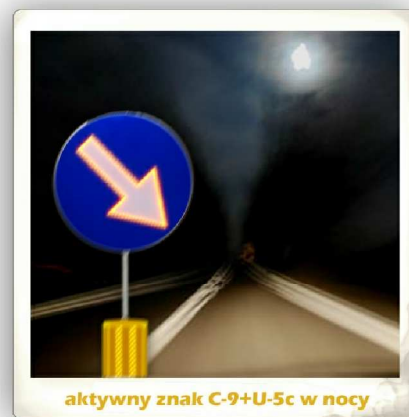
aktywny znak C-9+U-5c w nocy