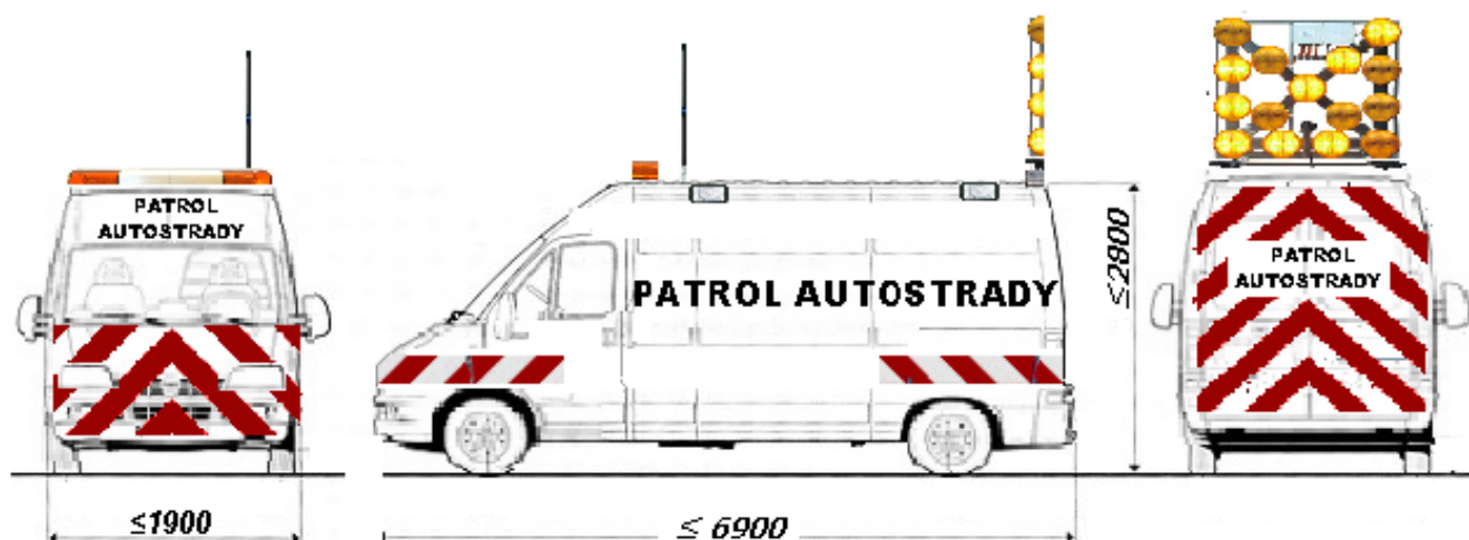
Schemat nr 4.

2.2 Pracownicy powinni być ubrani w odzież zapewniającą dobrą ich widoczność na drodze.