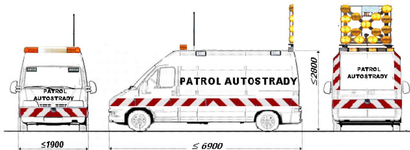
Schemat nr 1.