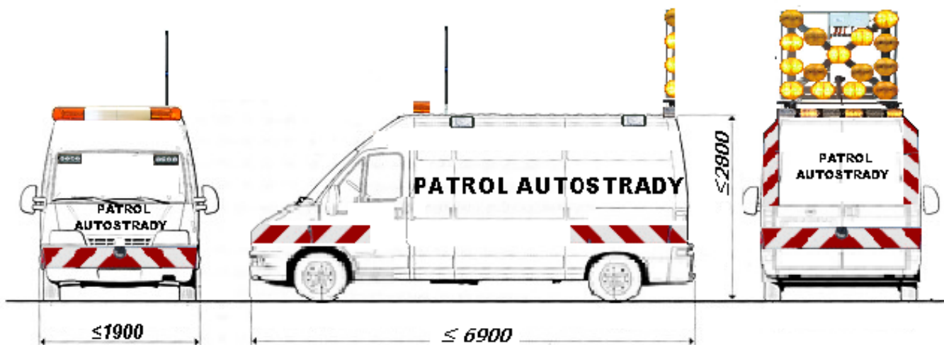
Schemat nr 2.