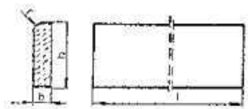
Rysunek 1. Kształt betonowego obrzeża chodnikowego Tablica

Kształt obrzeży betonowych przedstawiono na rysunku 1, a wymiary podano w tablicy 1.