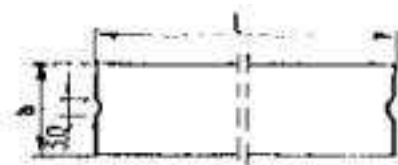
Rys. 1. Wymiarowanie krawężników

) wpusty na powierzchniach stykowych krawężników