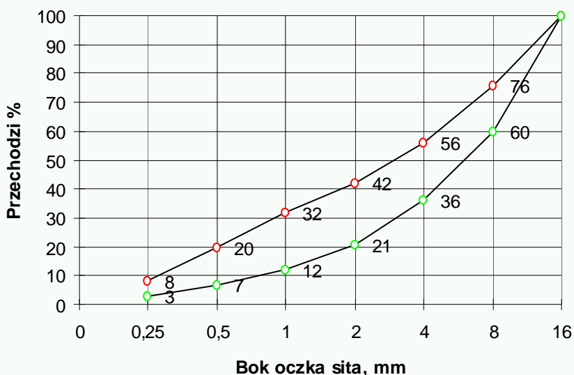
Graniczne krzywe uziarnienia kruszywo 0 - 31.5 mm