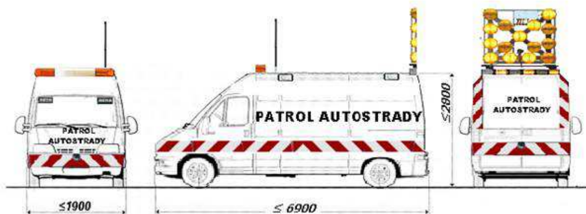
Schemat nr 4