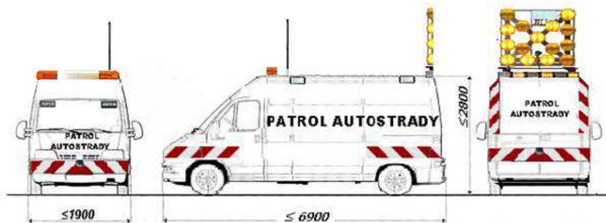
Schemat nr 3