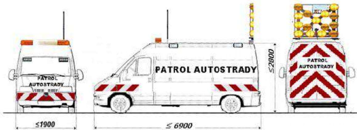
Schemat nr 2