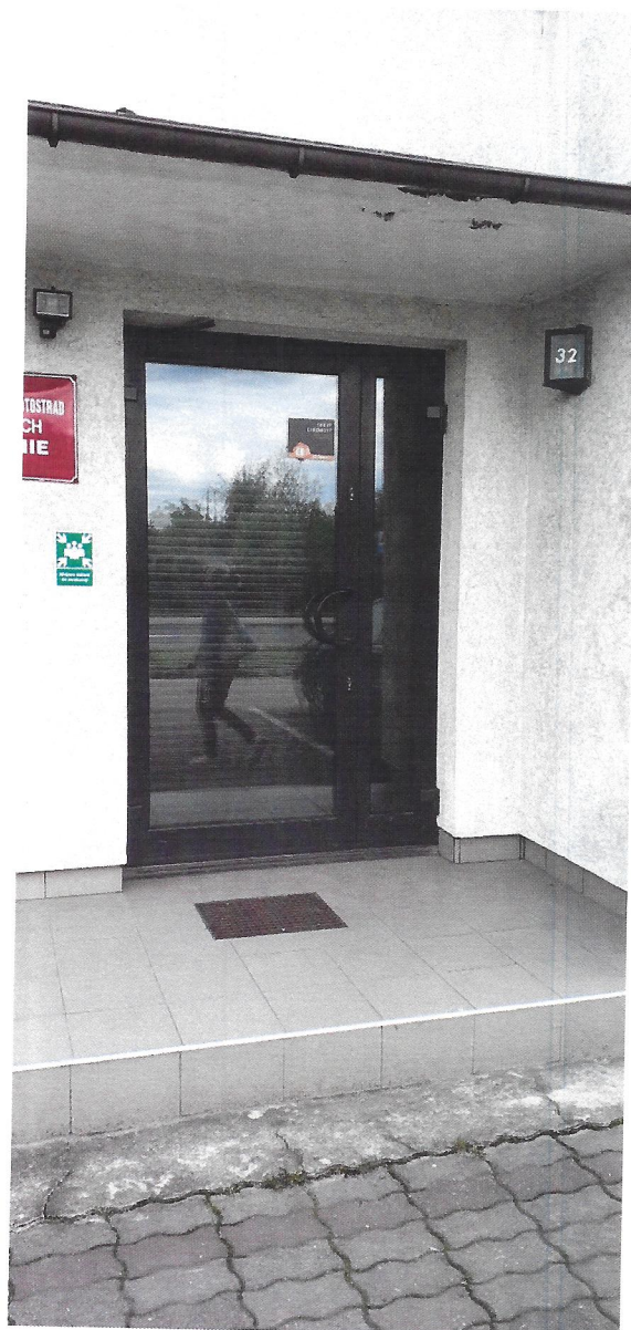
widok na drzwi do wymiany od strony parkingu przy ulicy Bielskiej (w tym montaż videofonu)