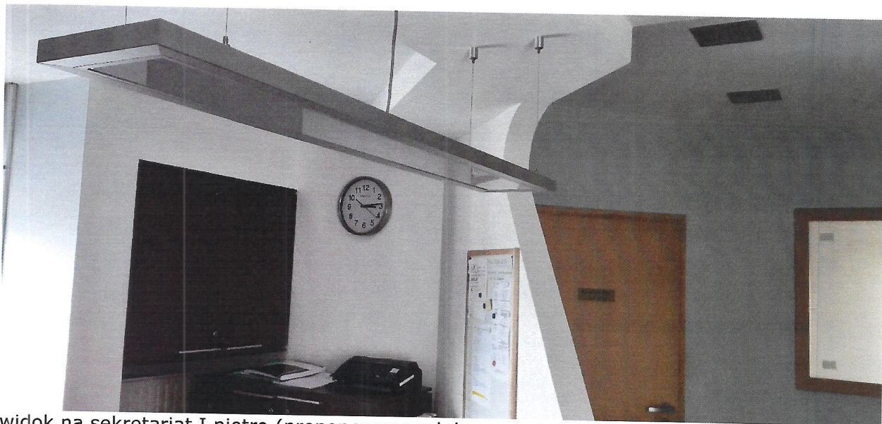
widok na sekretariat I piętro (proponowane miejsce montażu videofonu)