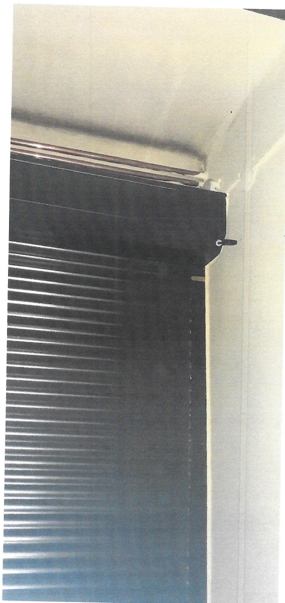
widok na wiatrołap parter (roleta bez zmian)