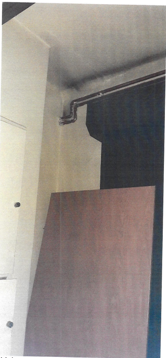
widok na wiatrołap parter (roleta bez zmian)