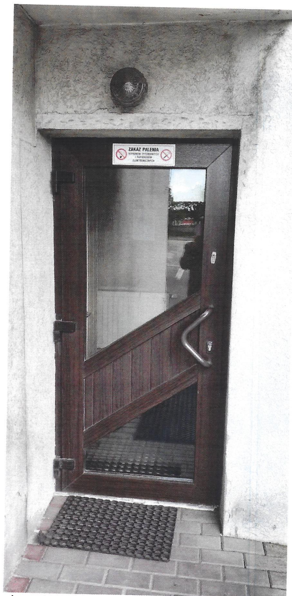
widok na drzwi do wymiany od strony placu i parkingu wewnętrznego (w tym elektrozamek z klawiaturą kodową)