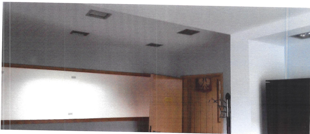
widok na strop sekretariatu i wyjście na korytarz I piętro (przejście z instalacją do łączności z videofonem)