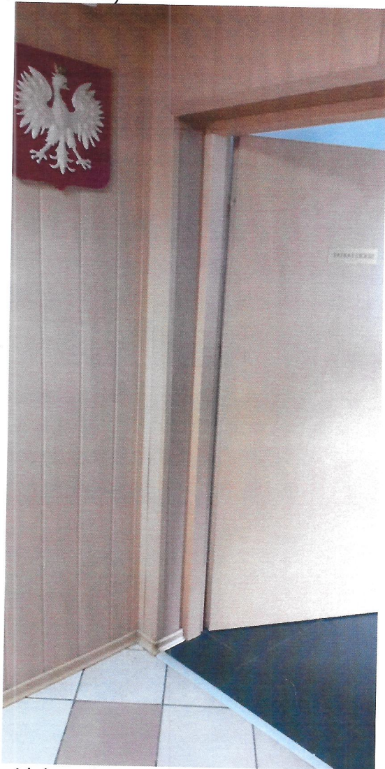
widok na korytarz I piętro

(przejście z instalacją do łączności z videofonem)