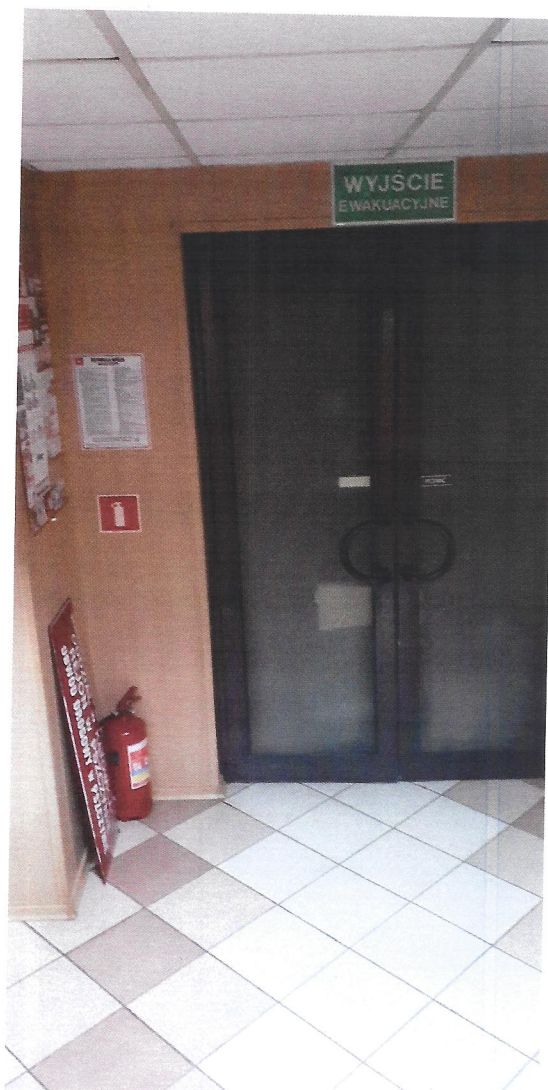
widok na parter (drzwi do demontażu)

(przejście z instalacją do łączności z videofonem)