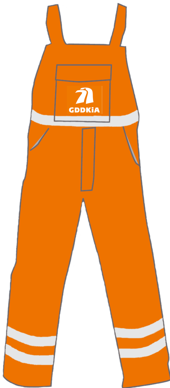
spodnie letnie i zimowe