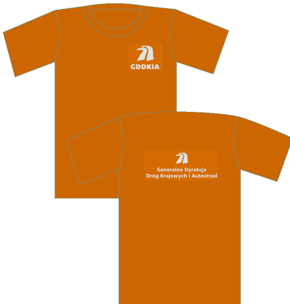
koszulka bawełniana z krótkim rękawem - przód i tył