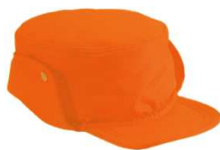
czapka letnia i zimowa