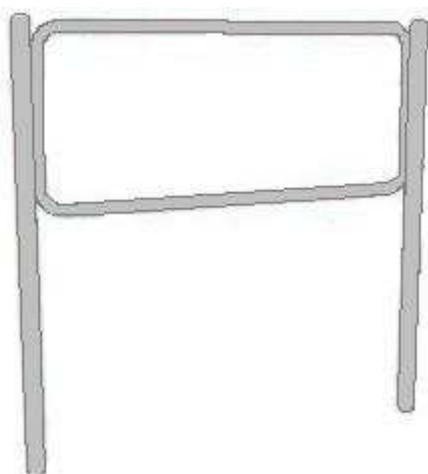
Rys. 1 Wymagany kształt ogrodzeń segmentowych U-12a typu lekkiego z wypełnieniem rurowym.

Zamawiający przewidział do rozbiórki 336 m balustrad U-11a oraz 172m ogrodzeń łańcuchowych U-12b. W miejscu usuniętych barier i ogrodzeń przewidziane jest ustawienie 508 m ogrodzeń segmentowych rurowych typu lekkiego. Zamawiający wymaga, aby ogrodzenia segmentowe U-12a przewidziane do ustawienia były zgodne z wymaganiami Rozporządzenia Ministra Infrastruktury z dnia 3 lipca 2003 r. w sprawie szczegółowych warunków technicznych dla znaków i sygnałów drogowych oraz urządzeń bezpieczeństwa ruchu drogowego i warunków ich umieszczania na drogach (Dz. U. nr 220 z 2003 r. poz. 2181 z późn. zm. Wzór ogrodzeń powinien być zgodny z przedstawionym na rysunku nr 1. Wypełnienie rurowe pomiędzy słupkami typu lekkiego. Wszystkie elementy konstrukcji ogrodzeń powinny być ocynkowane ogniowo i pomalowane proszkowo na kolor szary.