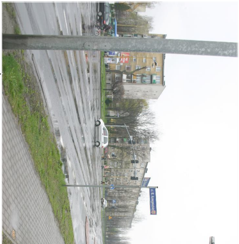
Sygnalizacja ul. Al. Słowackiego-Konopnickiej w Ostrówie Wlkp.