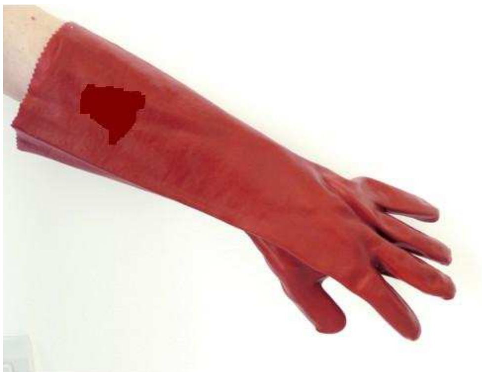
Rękawica ochronna – rodzaj 2