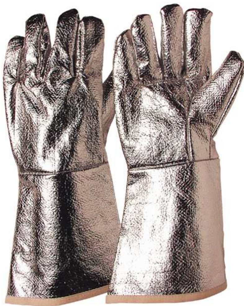
Rękawice odporne na wysoką temperaturę