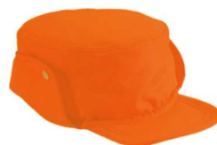
czapka letnia i zimowa