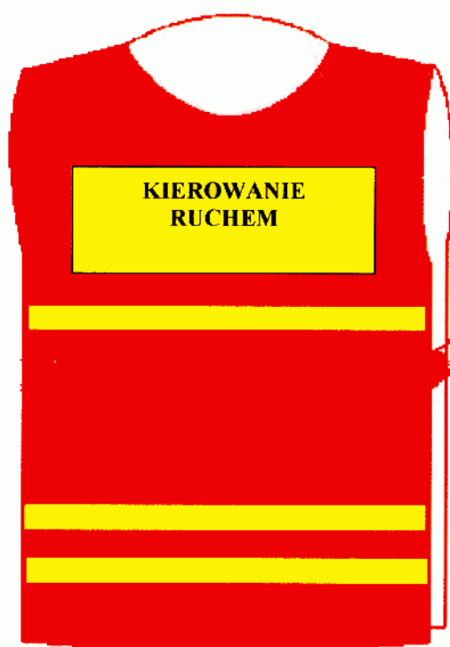
Narzutka — przód