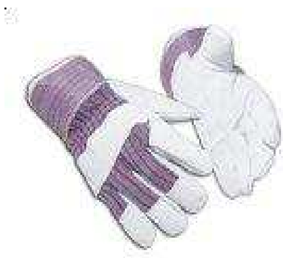
Rękawica robocza – rodzaj 2