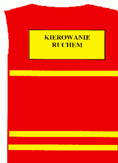
Narzutka — tył