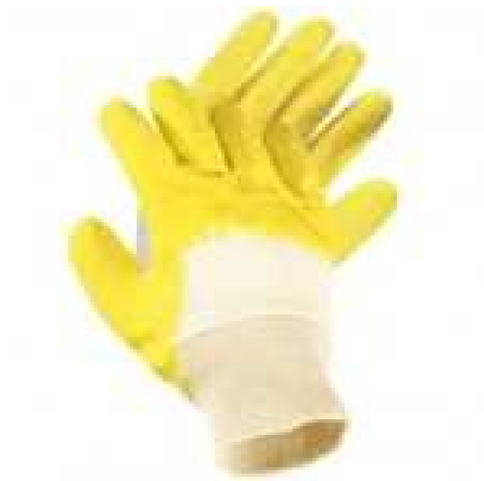
Rękawice robocze – rodzaj 3