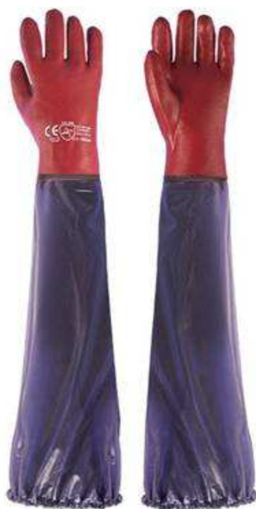
Rękawica ochronna – rodzaj 3,