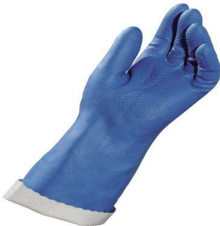
Rękawice do pracy z rozpuszczalnikami organicznymi