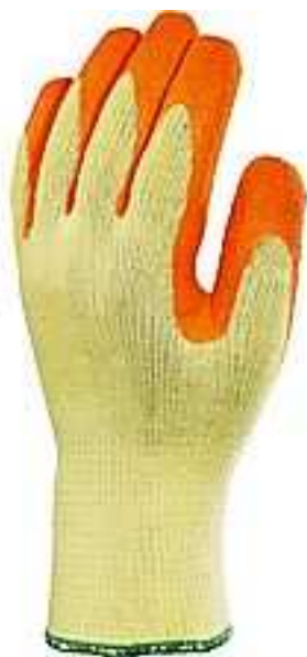
Rękawica robocza – rodzaj 1