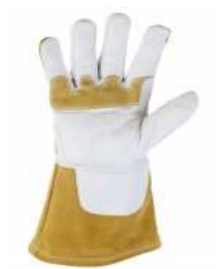
Rękawica dla spawacza