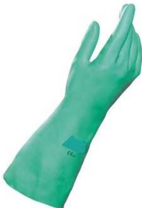
Rękawice do pracy z substancjami żrącymi