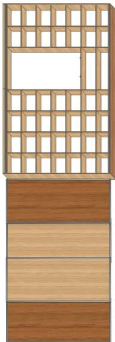
RYSUNEK NR 1