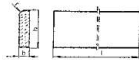
Rysunek 1. Kształt betonowego obrzeża chodnikowego

Kształt obrzeży betonowych przedstawiono na rysunku 1, a wymiary podano w tablicy 1.