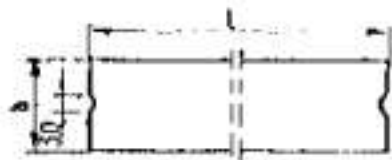
Rys. 1. Wymiarowanie krawężników

b) wpusty na powierzchniach stykowych krawężników