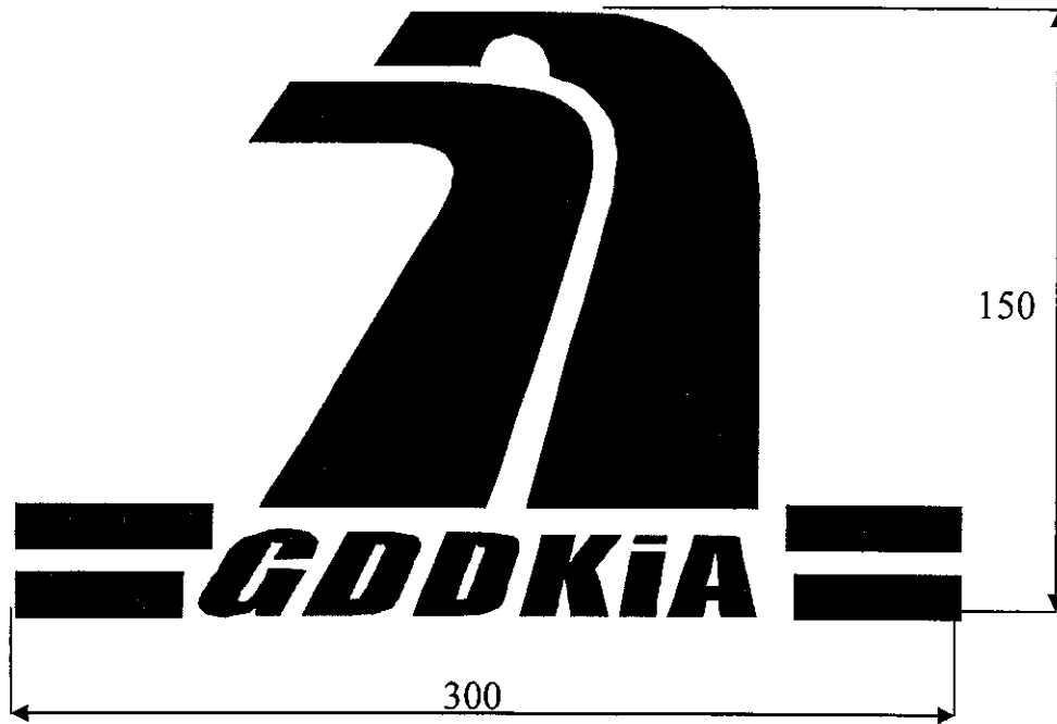
Rys. nr 1