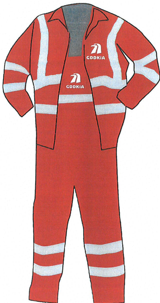
ubranie 2-częściowe letnie, zimowe - przód