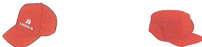
czapka letnia i zimowa