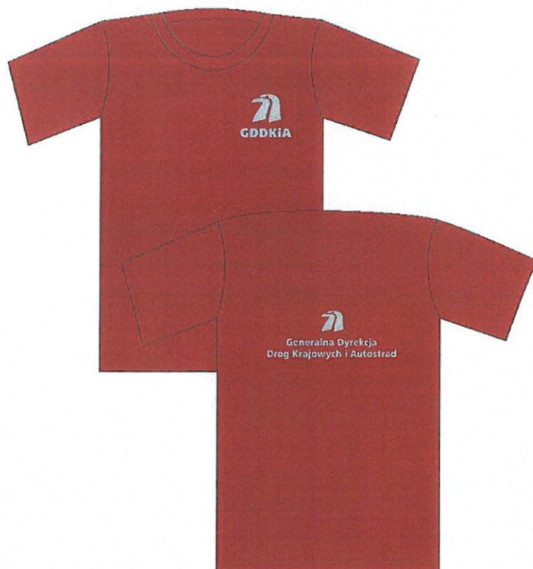
koszulka z krótkim rękawem - przód i tył