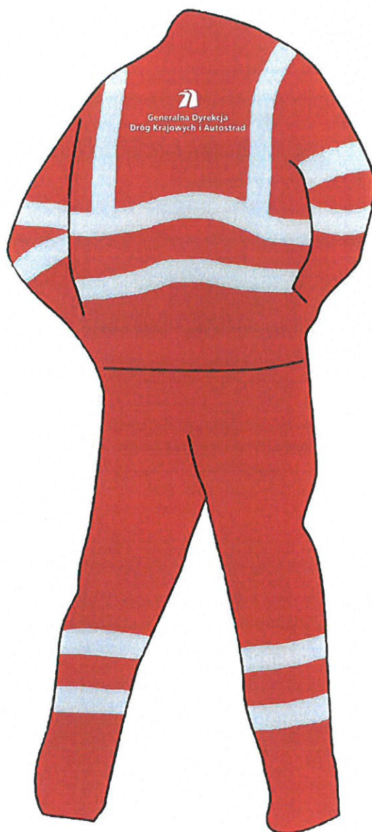
ubranie 2-częściowe letnie, zimowe - tył